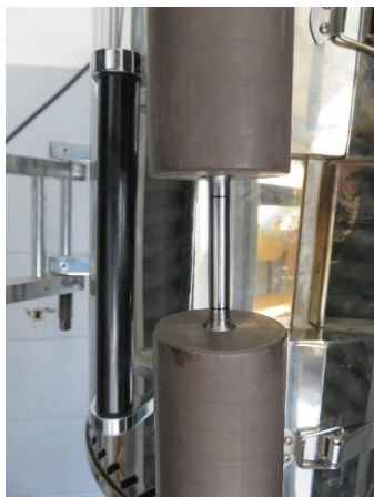
Postavljanje epruvete u držače, fot. 3