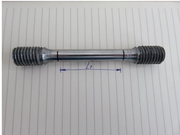
Obeležavanje epruvete, fot. 1

Na fotografijama je prikazana metoda određivanja granice tečenja materijala na povišenim temperaturama.