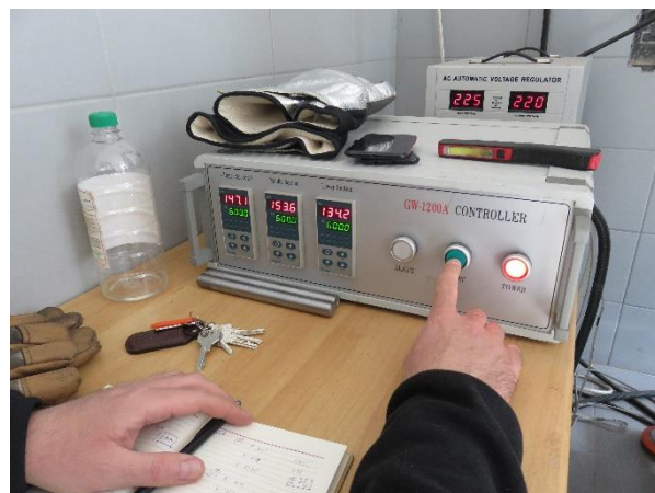
Zadavanje ispitne temperature, fot. 6.