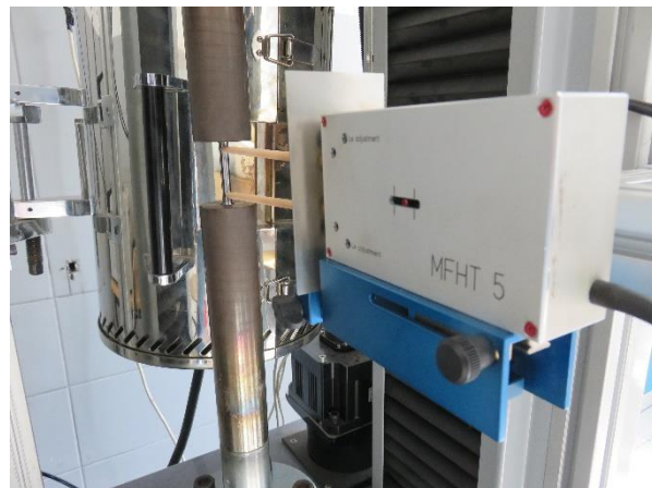
Postavljanje ekstenziometra na epruvetu, fot. 4