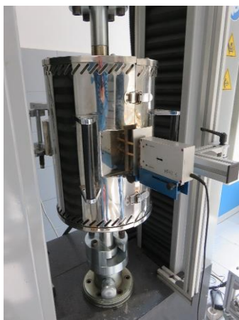
Montiranje peći, fot. 5